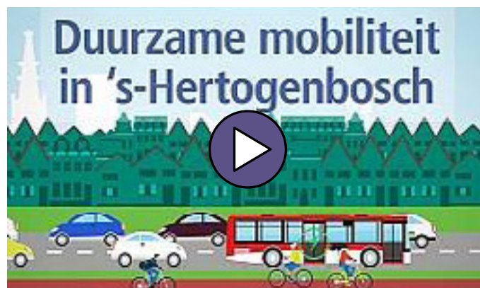
Animatie: Slimme weg

toegankelijk en slim is. Het actieplan bestaat uit vier werklijnen: gedrag, samenwerking, infrastructuur en technologie. Het plan omvat talloze acties die we de komende jaren gaan ondernemen. Zo gaan we alle vormen van duurzaam vervoer stimuleren, voor inwoners en forenzen. We beginnen met de fiets en besteden daarna aandacht aan elektrisch rijden en deelmobiliteit. We verkennen in hoeverre mobiliteit voor iedereen in de gemeente beschikbaar is. Als datastad benutten we de kracht van data en slimme mobiliteit optimaal. Tot slot maken we onze infrastructuur op orde. We zetten daarbij volop in op de fiets, zoals met snelfietsroutes naar Zaltbommel en Eindhoven. En we investeren in gratis fietsenstallingen. Ook realiseren we voor inwoners en bezoekers met een elektrische auto meer laadpalen.