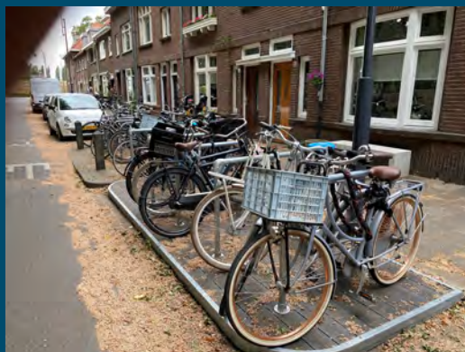
De fietsvlonder in de Van der Weeghensinghel. De omwonenden zijn er blij mee.