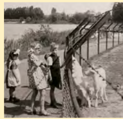
Bij de geitjes in 1951