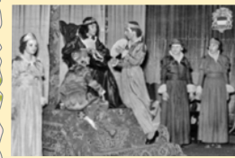
Toneelstuk in 1960

Het Paschalishuis op de Orthense weg was een soort buurthuis waar vaak toneelvoorstellingen waren.