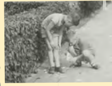
Jongens knikkeren in 1960.

Enkele spelen van die tijd zijn: touwtje springen, kaatsebal, voetballen en tolleren.