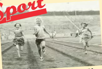
Hardloopwedstijd eind jaren 50

Nadat B.V.V. in 1948 landskampioen werd besloot de gemeente een groot sportpark aan te leggen in De Vliert. Het werd een voetbalveld /atletiekbaan en werd in 1951 geopend door de atlete Fanny Blankers-Koen. De baan werd voor veel sporten gebruikt: Atletiek, paardenrennen, motorcross en zelfs autoracen! Veel te zien dus in De Vliert.