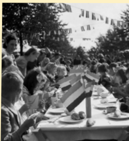
Koninginnedag 1945 voor alle kinderen van de Muntel